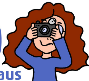
Foto-Wettbewerb Mein Rudolfsheim-Fünfhaus